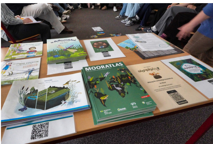
Aus dem Moorkoffer

Zu jedem der vier Schwerpunkte waren externe Expertinnen geladen, die sich über ihre Themen mit den Studierenden ins Gespräch begaben und dabei Frage und Antwort standen. Gemeinsam wurde nach Lösungen und Wegen gesucht, wie sich die teils kontroversen Inhalte an die Schulen bringen lassen. Die einzelnen Beiträge werden in Form von Imagefilmen im Nachgang professionell geschnitten und über die Institutsseite öffentlich verfügbar gemacht. Im kommenden Studienjahr ist eine Öffnung der Veranstaltung für Lehrkräfte und Interessierte geplant.