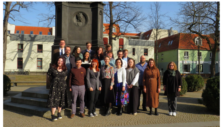
Gruppenfoto der Konferenz 2026

Gemeinsam mit dem Praktikumsbüro, dem International Office und dem GULB wird aktiv am Ausbau des Schulnetzwerks im Ausland gearbeitet. Es finden Gespräche mit relevanten Akteuren im Schulwesen (Ministerien, Schulleitungen und Zentralstellen für das Auslandsschulwesen) statt.