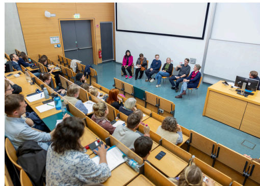
Auftaktveranstaltung am 22.04.2026

Die Veranstaltung machte damit sichtbar, dass demokratische Handlungssicherheit nicht selbstverständlich vorausgesetzt werden kann, sondern stärker als gemeinsame Professionalisierungsaufgabe verstanden werden sollte.