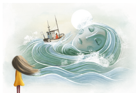
Illustration zu „Hoiho!“ (Stephanie Wunder)

Die Vertonungen werden am 17.06.2026 erstmals im Rahmen einer Lehrer*innenfortbildung im Pommerschen Landesmuseum vor Schulklassen aus Greifswald und Umgebung öffentlich präsentiert, wobei auch die Unterrichtshandreichung erläutert und erprobt werden kann.